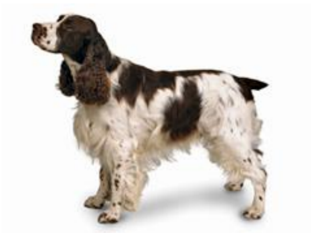
Спрингер-спаниэль / Кокер-спаниэль