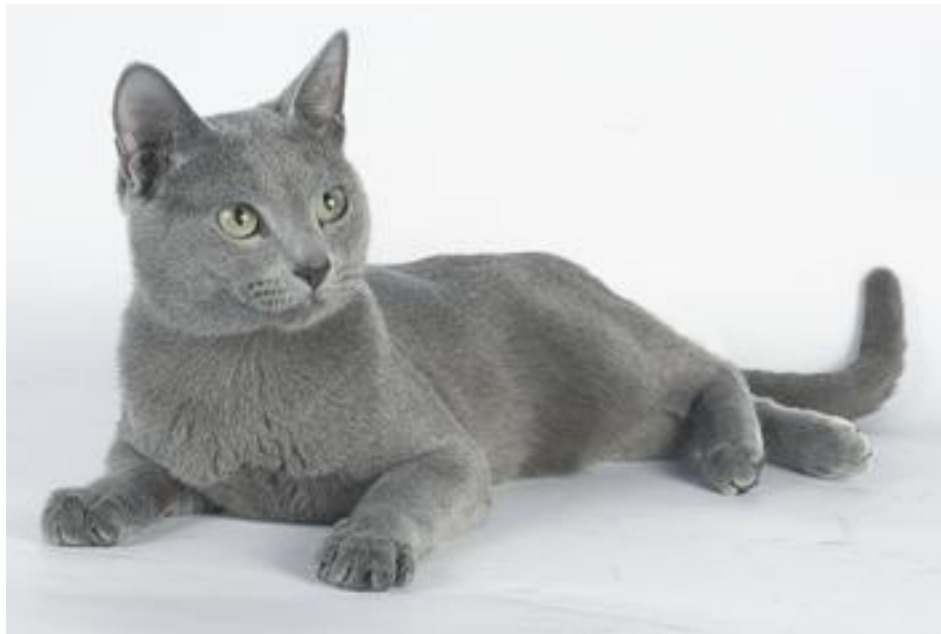
Русская голубая кошка