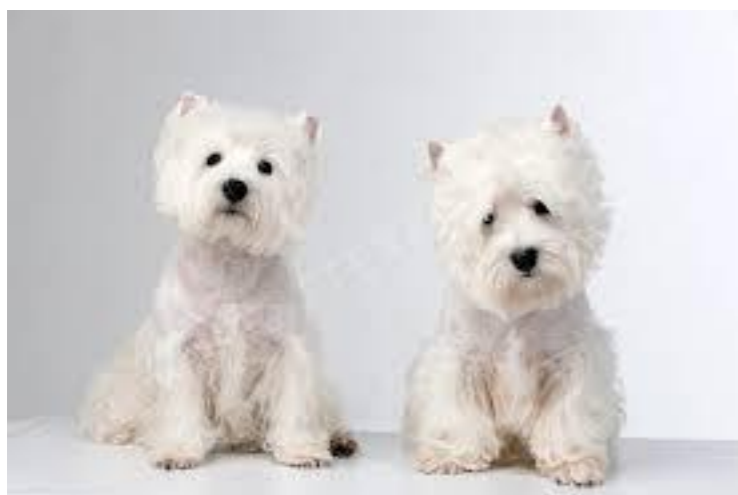
Вест хайленд уайт терьер