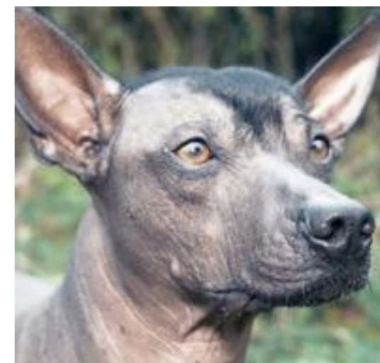
Мексиканская голая собака