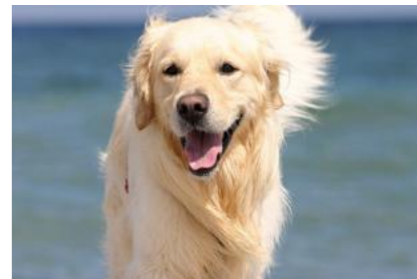
Золотистый ретривер/ лабрадор