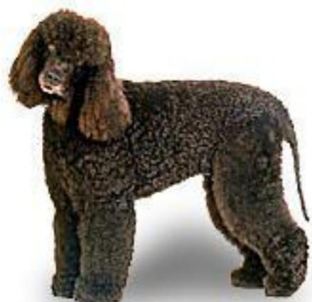
Ирландский водяной спаниель